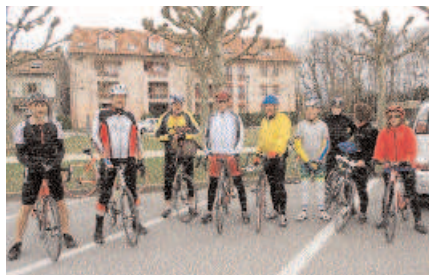
Départ de Vernier

Brevet Jean Brun (70/100 km). Départ 8h30 - 10h, centre sportif de Vessy pour un parcours traditionnel. Arrivée possible jusqu'à 15h30.