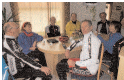
C'est aussi ça le club

Sortie route 40-50km. Départ 13h30, place des Ormeaux, Petit-Lancy.